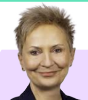
Ewa Lubianiec Starosta Powiatu Piaseczyńskiego